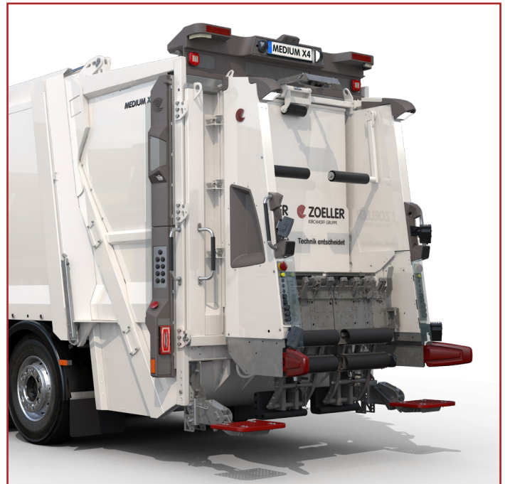
ZOELLER SYSTEM 2322 DELTA

ZOELLER garantiert mit seiner Plattformstrategie termin-gerechte Produktion von höchster Qualität und absoluter Flexibilität für individuelle Kundenwünsche.