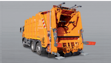
ROTARY III -2406