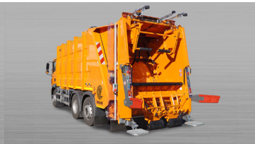
ROTARY III -2406