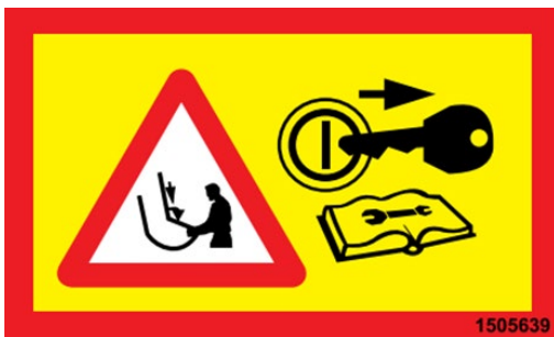
Obligatorisches Abschalten des Motors und Abziehen des Zündschlüssels vor Beginn von Wartungsarbeiten