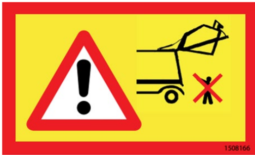
Verbot des Aufenthalts unterhalb des Heckteils