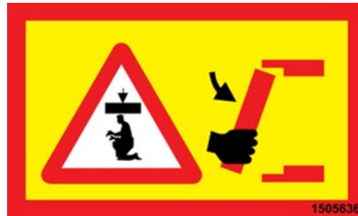
Obligatorische Verwendung von Stützen