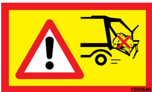
Verbot des Fahrens mit Abfall in der Ladewanne