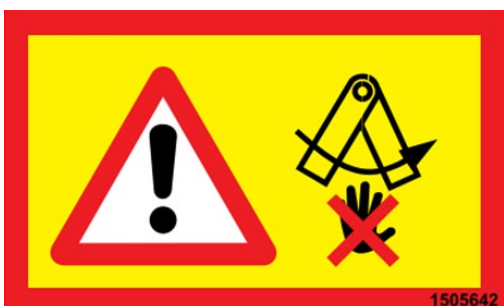
Verbot des Haltens von Händen an beweglichen Teilen