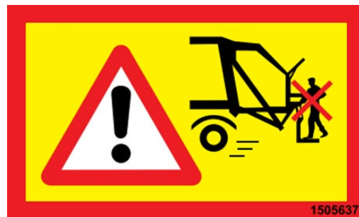
Verbot des Fahrens auf dem Trittbrett bei Rückwärtsfahrt