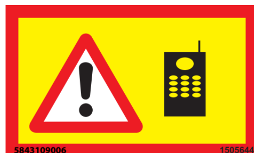
Verbot der Benutzung von Mobiltelefon während des Betriebs des Aufbau