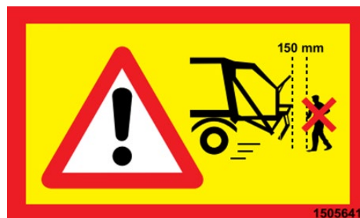
Obligatorische Einhaltung eines Sicherheitsabstands von 150 mm zu den Armen des Lifters